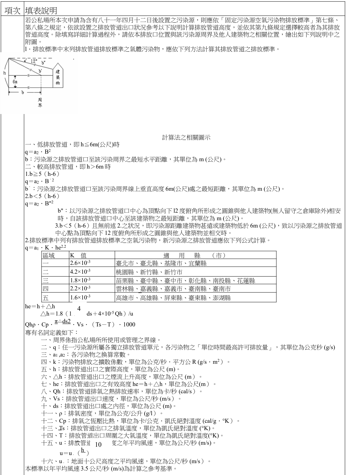
表 AP-P (續一)